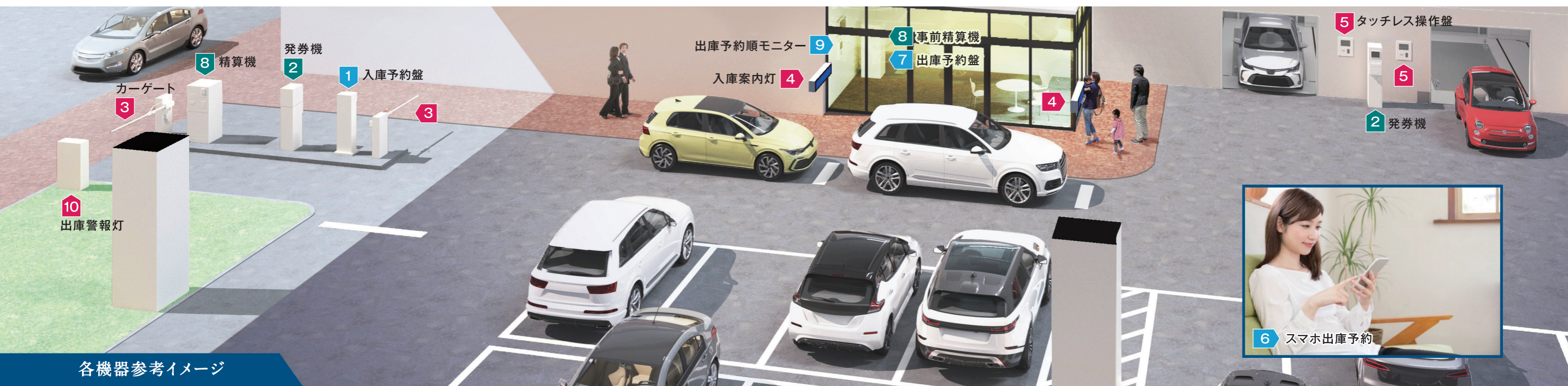
各機器参考イメージ